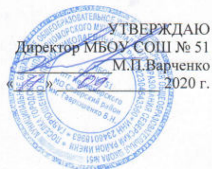
График проведения плановых заседаний психолого-педагогического консилиума на 2020-2021 учебный год

Муниципальное бюджетное общеобразовательное учреждение средняя общеобразовательная школа № 51 поселка городского типа Черноморского муниципального образования Северский район имени Гаврюшенко Валерия Николаевича